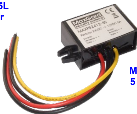
MAXPS2412-5S 5 A - Switching

Utilizados sobretudo em sistemas de detecção de incêndio a operar em 24 VDC, para adaptar equipamentos a funcionar em 12VDC tais como: