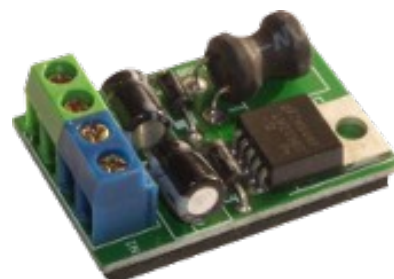
MAXPS2412-1S 1 A - Switching